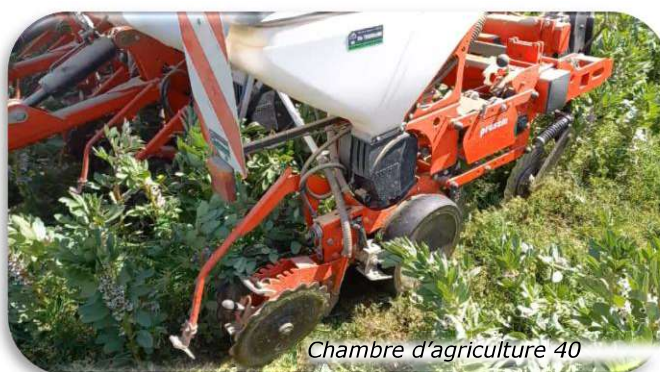
Chambre d'agriculture 40

Le semis se fait avec des semoirs pour semis direct, en propre ou en CUMA, ou avec un semoir adapté par l'agriculteur.