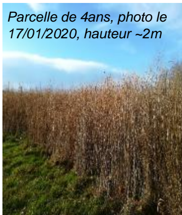
Parcelle de 4ans, photo le 17/01/2020, hauteur ~2m

sols gorgés d'eau en hiver (récolte complexe) sols très caillouteux (plantation difficile) forte pression d'adventices vivaces