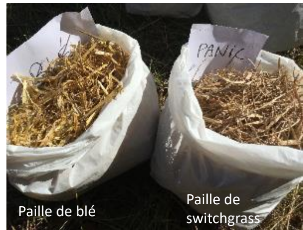
Paille de blé

Étudier l'intérêt et les risques d'une récolte précoce (fin d'été/automne) pour éviter des récoltes en hiver sur sols peu portants