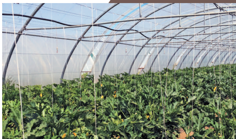
▲ Essai courgette