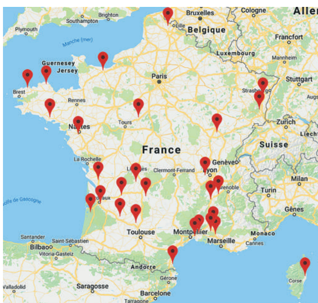
Carte des dispositifs expérimentaux en légumes associés et/ou partenaires avec le réseau des Chambres d'agriculture.

https://chambres-agriculture.fr/recherche-innovation/experimentation/sites-dexperimentation/