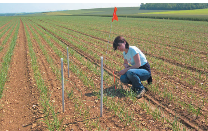
▲ Suivi et pilotage d'irrigation dans une parcelle d'oignons